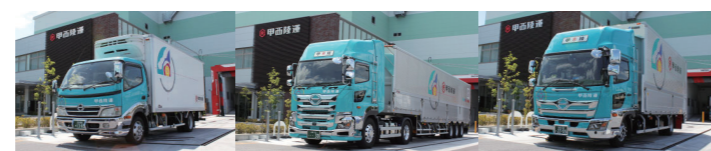
100台の車輛を保有し、全車にドライブレコーダーやデジタコ機能搭載

近畿・中部地区を中心に、ルート配送網を構築しております。現在は主に住宅建材・部品などを取り扱っており、固定されたルートに沿って配送するため同時に小ロット貨物を低コストでの輸送で実現しています。